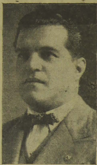
Deputado Baptista Luzardo

“No Brasil inteiro, de Norte a Sul, do Amazonas ao Rio Grande, diz o brilhante parlamentar gaúcho, só existe uma idéa, só predomina um pensamento: o Brasil precisa ser reformado já e já, dentro da lei ou fóra da lei”